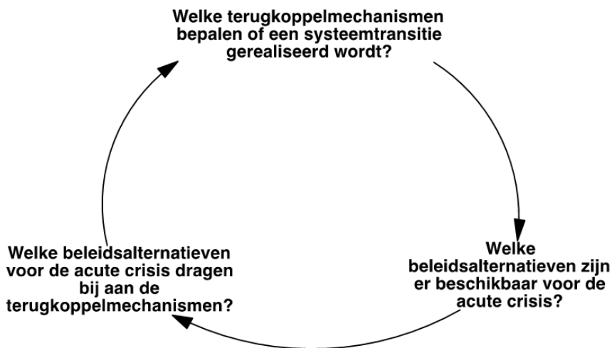
Figuur 1 Cyclus voor het meekoppelen van de lange met de korte termijn

Als er beleid is voor de korte termijn dat ook helpt om terugkoppelingen voor de lange termijn te adresseren, zeggen we dat er sprake is van een 'meekoppelkans'. Andersom kunnen er ook situaties zijn waar het tegenovergestelde kan gebeuren: het kortetermijnbeleid kan terugkoppelmechanismen in gang zetten die het juist moeilijker maken om de sluipende crisis te bezweren (denk aan padafhankelijkheden); dit noemen we 'meekoppelrisico's'. Hieronder lichten we de cyclus toe aan de hand van de casus waarbij de coronapandemie de acute crisis vormt en de klimaatcrisis de sluipende crisis.