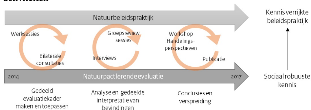
Figuur 1 Schematische weergave van de lerende evaluatie van het Natuurpact (2014-2017) met daarin de drie fasen van het onderzoek inclusief de centrale activiteiten

De evaluatie bestond uit drie fasen: (1) ontwikkeling van een gedeeld evaluatiekader; (2) analyse en gedeelde interpretatie van de bevindingen; en (3) trekken van conclusies en verspreiding daarvan (figuur 1). De lerende evaluatie is opgezet als een interactief proces tussen beleid en onderzoek. Deze interacties bestonden ten eerste uit vier overkoepelende leer- of werksessies waar vertegenwoordigers van Rijk, provincies en maatschappelijke partijen aan deelnamen. Het doel verschilde per evaluatiefase; van het verzamelen van evaluatiebehoefte, naar het gezamenlijk formuleren van handelingsperspectieven. Ten tweede vond structureel interactie plaats met de IPO-werkgroep Natuurbeleid om de kwaliteit en bruikbaarheid van de evaluatie af te stemmen. In deze werkgroep is elke provincie vertegenwoordigd door een beleidsmedewerker. Samen vertegenwoordigen zij de evaluatiebehoefte van de provincies. Ten derde vond er interactie plaats tijdens reguliere onderzoeksactiviteiten, zoals interviews met beleidsbetrokkenen en groepsgesprekken. Ten slotte was er een aantal keren per jaar een ambtelijk en bestuurlijk overleg met LNV en IPO om de voortgang en landing van het onderzoek te waarborgen.