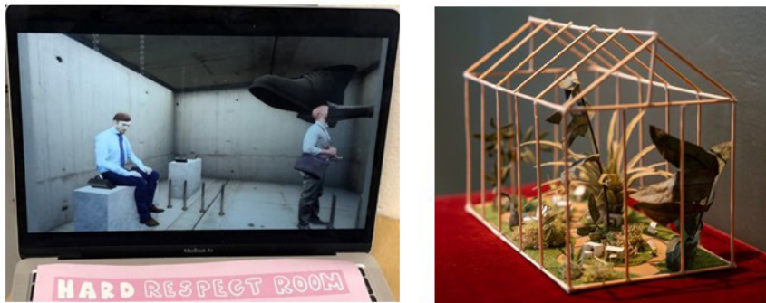
Figuur 4 Verbeeldingen van het lerarentekort: van 'hard' naar 'soft' respect

De verbeeldingen van het lerarentekort vervulden na afronding van het onderzoek door de studenten een rol in ex-ante onderwijsbeleidsprocessen. In een publicatie (De Vries et al., 2023) zijn de verbeeldingen gedeeld met het publiek (onder andere leraren, schoolleiders) om tot dialoog over schoolspecifieke aanpakken aan te zetten. Met OCenW wordt verkend hoe de verbeeldingen zouden kunnen worden meegenomen in voorbereidende gesprekken over regio-aanpakken, eveneens om de dialoog over de problematiek vanuit nieuwe invalshoeken te voeden.