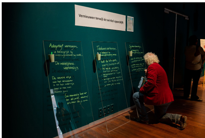
Figuur 2 Dialogofunctie van een onderzoeksevent