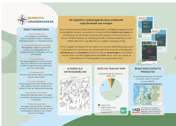
Figuur 1 Overzicht bouwstenen

De bouwstenen geven elk op eigen wijze invulling aan het dialogische karakter dat we met het onderzoek nastreefden. In de veld- en interventiestudies trokken de onderzoekers vanaf het begin samen met de praktijkpartners op, zodat het onderzoek een bij de praktijk passende vraagstelling en invulling kreeg. In de bouwstenen praktijkvalidatie en Kunst Dialoog Methodes werkten we met group concept mapping (een groep visualiseert de eigen ideeën en inzichten) en creatieve werkvormen die tot doel hadden professionele dialoog in bestaande teams en tussen professionals van verschillende organisaties en sectoroverstijgend tot stand te brengen. In TeacherTapp – een dagelijkse digitale survey onder meer dan 1000 leraren en leidinggevenden uit het primair, voortgezet en middelbaar beroepsonderwijs – is een wekelijkse cyclus van dataverzameling-data-analyse-kennisdeling-feedback opgezet waarbij deelnemers tussentijds op de hoogte raakten van onderzoeksuitkomsten en hierop konden reageren. Ook konden deelnemers bijdragen aan de ontwikkeling van vragen die in TeacherTapp gesteld zijn. In de vignettenstudie is de professionele dialoog vertaald naar één-op-één gesprekken over scenario's van veranderprocessen waarin verschillende perspectieven van betrokkenen uitgelicht waren. We nodigden deelnemers aan het onderzoek uit om de verschillende perspectieven in te nemen en van daaruit een reactie te geven op de verandersituatie.